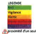
Illustration 4: Niveaux des nappes aux piézomètres de référence

En conclusion, il n'est pas pris d'arrêté limitant les usages de l'eau dans le département de l'Oise au 15 mai 2018.